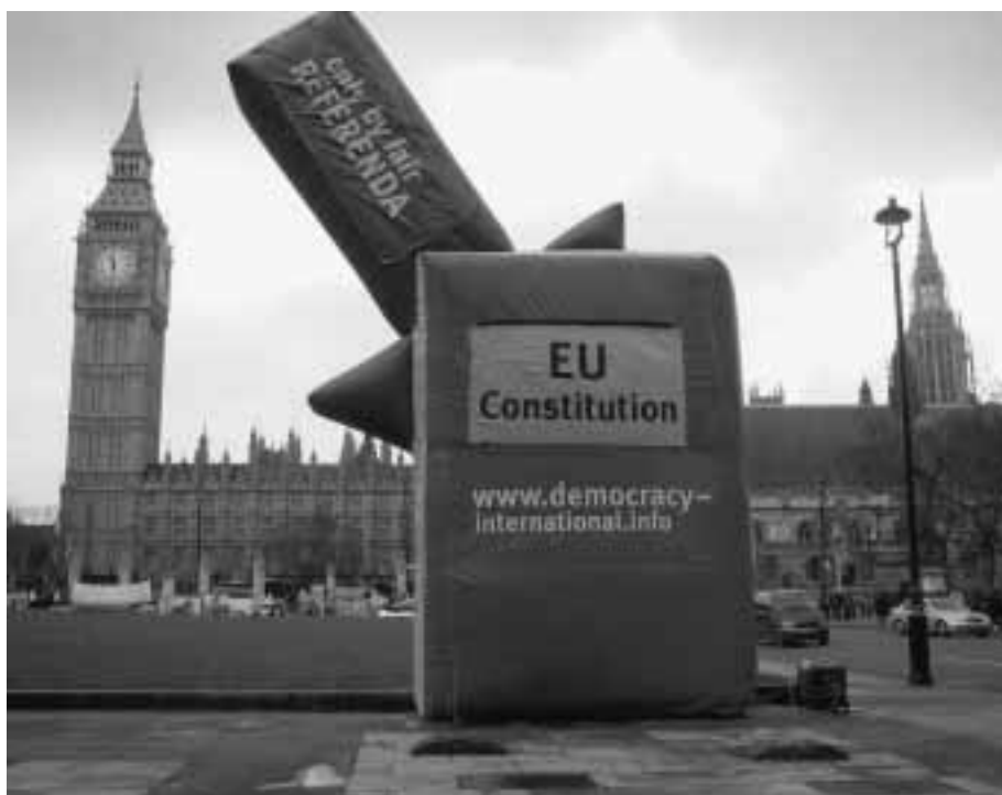
De burgers in Europa eisen zeggenschap over de toekomst van de Europese Unie.

De grondwet viel dus in een losgeslagen, diffuus politiek klimaat. Een klimaat waarin handig politiek ondernemerschap zoveel meer ruimte heeft om verschil te maken. Hetgeen ons voert naar de tweede verklarende variabele: het referendum zelf, met in het bijzonder de campagne als verklaring van het 'nee'. Allereerst is het goed te beseffen dat nooit eerder de Nederlandse burger direct – d.w.z. bij volksraadpleging – was gevraagd zijn mening te