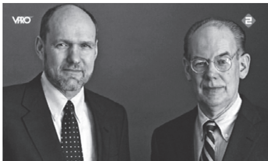
Stephen Walt en John Mearsheimer

heimer en Walt, het werk van met name de American Israel Public Affairs Committee (AIPAC).