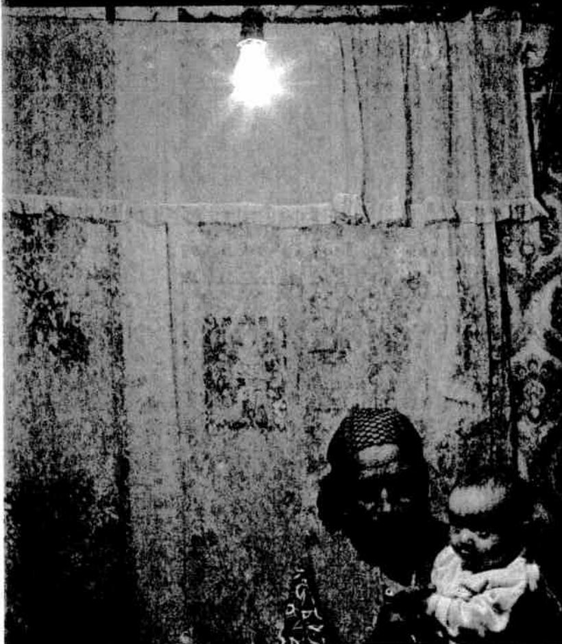
Een Kosovaarse Roma-vluchteling, Servië 2008