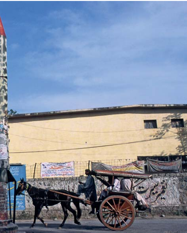
Het instabiele Pakistan toont graag zijn status als kernwapenmacht

‘kernwapens voor armoedzaaiers’ genoemd. Waar een land zich met een kernwapenstatus als (regionale) grootmacht kan doen gelden, is dat met deze categorieën wapens minder het geval. Dat heeft er mede mee te maken dat deze wapens uit militair oogpunt minder effectief zijn. Een raketkop met chemische of biologische lading kan in theorie veel leed aanrichten en angst zaaien, maar een nucleair wapen kan dat in veel grotere omvang (ook psychologisch). Bovendien blijkt de effectiviteit