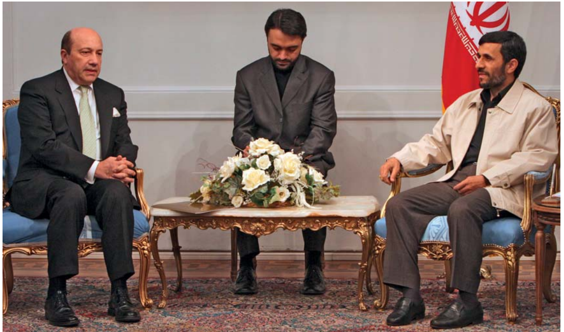
Als Iran kernwapens verwerft valt een preventieve aanval van bondgenoten van Nederland niet bij voorbaat uit te sluiten

wapens als laatste redmiddel zullen bewaren. Militaire conflicten zullen ook in de nabije toekomst hoogstwaarschijnlijk vooral met conventionele wapens worden uitgevochten.