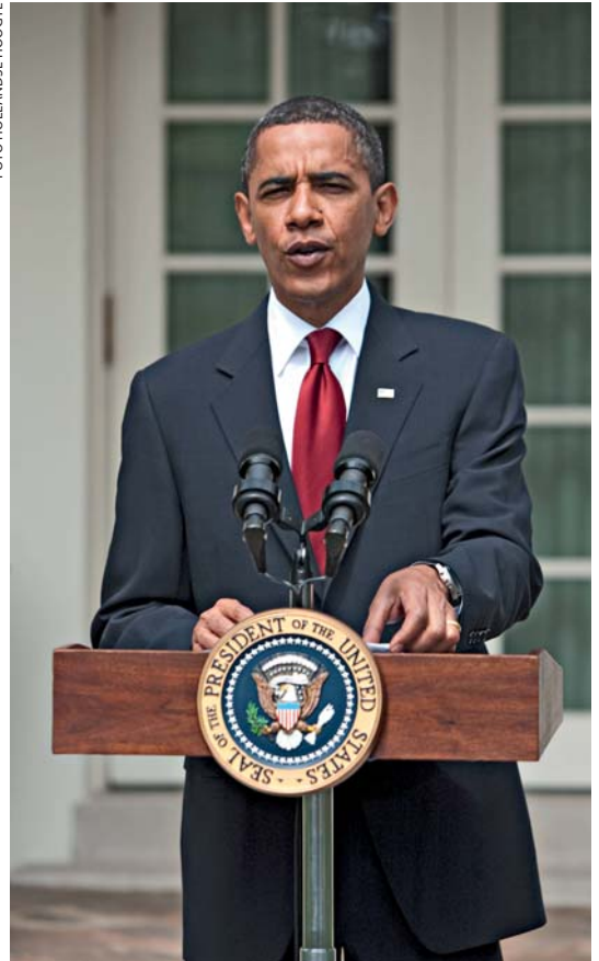
President Obama heeft de ambitie uitgesproken om het internationale non-proliferatieregime te versterken