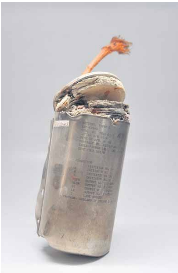
Landmijn uit Afghanistan, 2011

umdoelen voor de eenentwintigste eeuw) nog bij fraaie woorden en academische discussies, soms laten studies ook onverwacht bemoedigende resultaten horen. ‘We live in a decade of peace,’ concludeerde zelfs het Human Security Report in 2005 voor een haast ongelovig publiek. In een terugblik op de periode na de val van de Berlijnse Muur (1989) was er volgens de opstellers nog nooit zo weinig oorlog in de wereld gevoerd en daar waren nog nooit zo weinig mensen bij gesneuveld. De drie hoofdredenen die de onderzoekers daarvoor gaven waren: