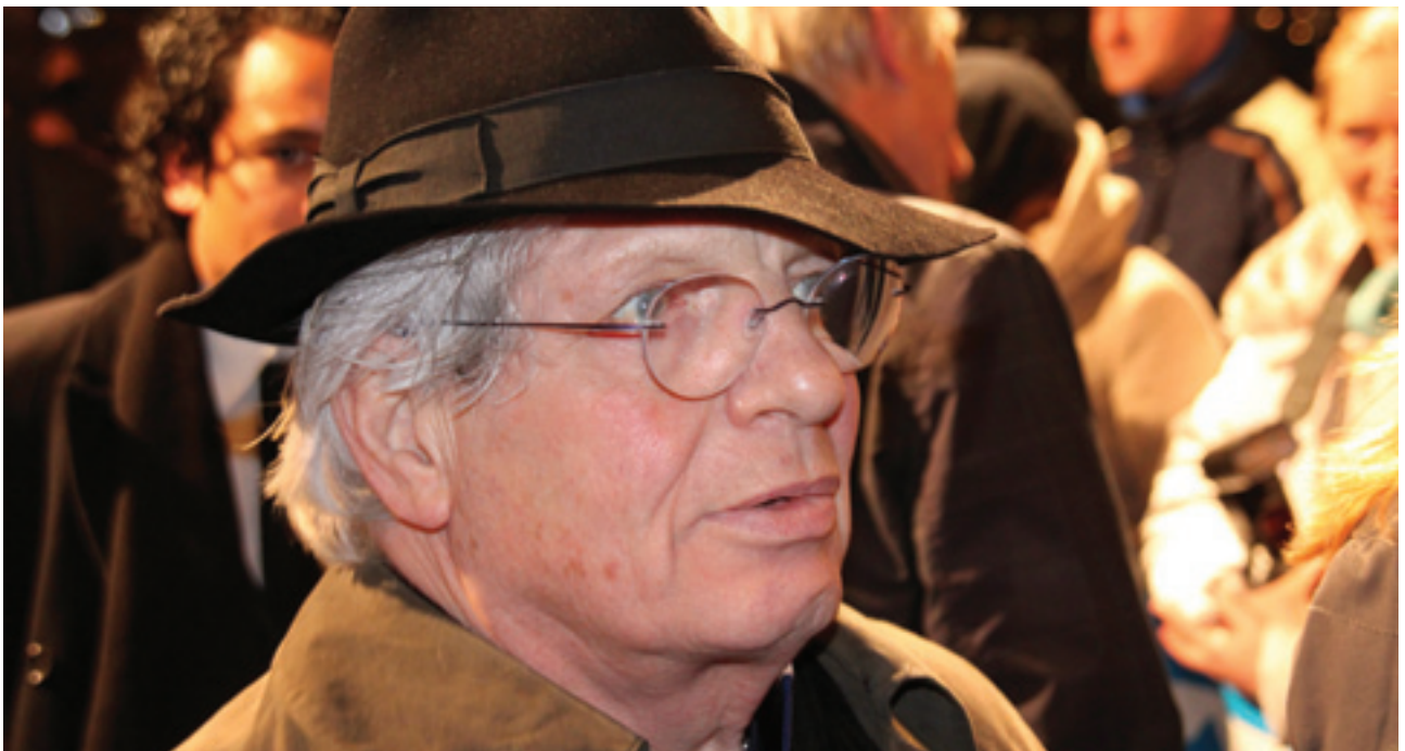
Abraham de Swaan