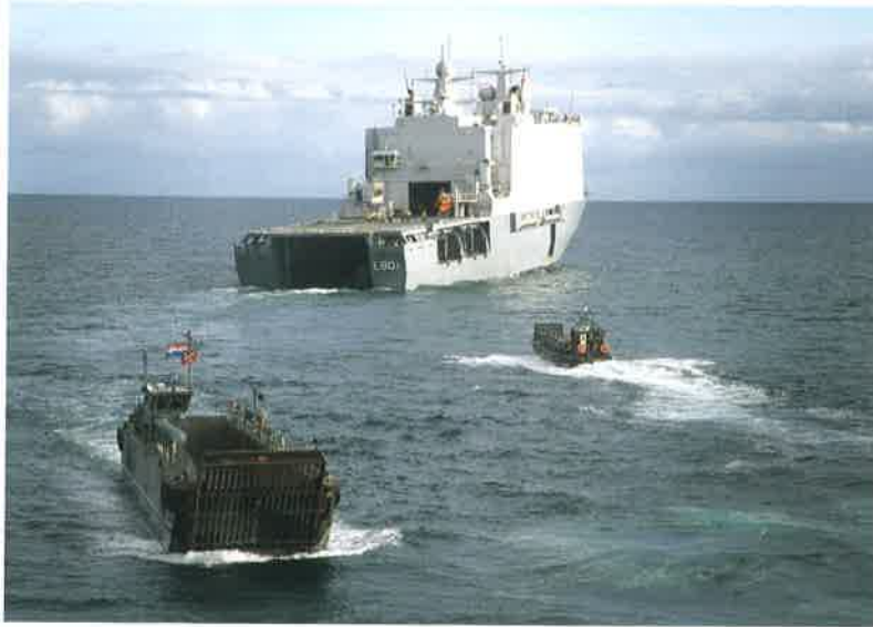
'Zeeën van toekomst'. Foto uit het artikel uit 2009: LPD Zr.Ms. Johan de Witt met landingsvaartuigen.

forces of good (Hedley Bull 7 ), zoals de aanzienlijke vervlechting en wederzijdse afhankelijkheid op regionaal vlak, de bloei van virtuele mondiale gemeenschappen die dankzij opleiding, mobiliteit en ICT en interactie op andere wijze langs de culturele en sociaaleconomische ladder het kader van louter competitieve natiestaten ontstegen zijn. Deze gemeenschappen kunnen het compenserende cement leveren dat een uiteenvallend multilateraal statensysteem steeds meer ontbeert. Ook politiek-economisch gezien is het beeld van een aangevreten multilateraal statensysteem niet dat van een stervend systeem. De financieel-economische vervlechting is ongekend groot. Het beeld van scherpe conflicten en de groeiende toepassing van sancties is het paradoxale bewijs daarvan: in een wereld zonder vervlechting zouden zij niet werken. De Russische gevoeligheid voor de olieprijs, de effectiviteit van de sancties tegen Iran op grond van het nucleaire programma, de Chinese zorg over de gevolgen van een Grexit zijn – naast de bitterheid van de tegenstellingen – tegelijkertijd indicatoren van het afhankelijkheidsbewustzijn. Kortom: geo-economie volgt niet dezelfde conflictlogica als geopolitiek.