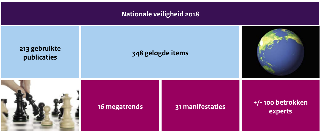
Figuur 4 De Horizonscan in cijfers

De beperkingen van de gekozen methodologische aanpak liggen voornamelijk in het vroeg in het proces trechteren van de vijf brede autonome ontwikkelingen naar megatrends. Als er meer tijd beschikbaar zou zijn geweest, zou deze stap meer tijd voor afweging verdienen. Een extra expertsessie, voorafgaand aan de definitieve keuze van de relevante megatrends, zou de afbakening nog zorgvuldiger hebben gemaakt. Tenslotte vereist het gebruiken van een en dezelfde methode door een grote groep experts van verschillende onderzoekachtergronden de nodige investering.