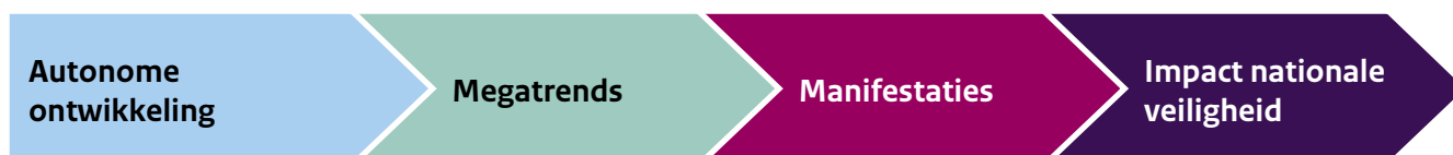
Figuur 2 Analyseketen

De eerste ronde scans levert een longlist op met relevante manifestaties per megatrend. Vervolgens wordt aan de hand van de verwachte en ingeschatte impact op nationale veiligheid een zogenaamde ' mediumlist ' samengesteld. De criteria hiervoor zijn een inschatting van de impact en waarschijnlijkheid van een manifestatie op de vijf nationale veiligheidsbelangen (territoriale, fysieke, economische, ecologische veiligheid en sociaal-maatschappelijke stabiliteit). Deze mediumlist wordt vervolgens in expertsessies bediscussieerd. Voor alle vijf thema's zijn aparte sessies georganiseerd, waarbij thematische experts van onderzoeksinstituten, universiteiten, ministeries en denktanks aanwezig waren (zie in de bijlage een lijst van organisaties). De scanteam hebben op deze sessies hun mediumlist gepresenteerd, waarna de experts werd gevraagd of zij zich konden vinden in de geïdentificeerde megatrends, manifestaties en welke zij hier nog misten. Deze discussies leidden tot een prioritering en soms ook tot het identificeren van 'open opties', een megatrend of manifestatie die tot dan toe aan het oog onttrokken was. Uiteindelijk levert dit gestructureerde proces een beeld op van de dringendste en belangrijkste ontwikkelingen die opdoemen aan de horizon van de Nederlandse nationale veiligheid.