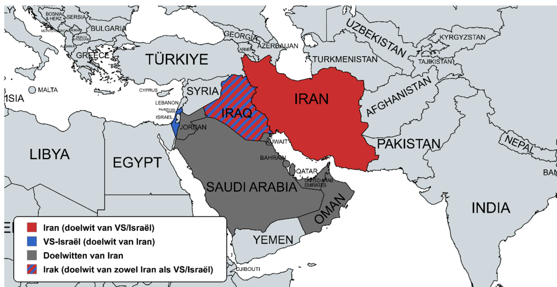
Afbeelding 1 Regionale militaire doelwitten

hebben om op deze aanvallen te reageren. Het is nog altijd afwachten wat de reactie gaat zijn van verscheidene aan Iran gelieerde groeperingen in de regio, die collectief onderdeel uitmaken van de As van Verzet (waar onder meer Hezbollah, Hamas, de Houthi en verscheidene pro-Iraanse milities in Irak onderdeel van uitmaken). Met name de Houthi in Jemen, Hezbollah in Libanon en de pro-Iraanse milities in Irak zouden militaire activiteiten tegen zowel Israël als Amerikaanse regionale militaire bases kunnen ondernemen. Daarnaast is in het geval van de Houthi de mondiale scheepvaart in de Rode Zee een mogelijk doelwit. Los van vijandige retoriek en ongeregelde heden rondom de Amerikaanse ambassade in Bagdad en het consulaat in Karachi, lijkt de reactie van deze groeperingen momenteel beperkt van aard te zijn.