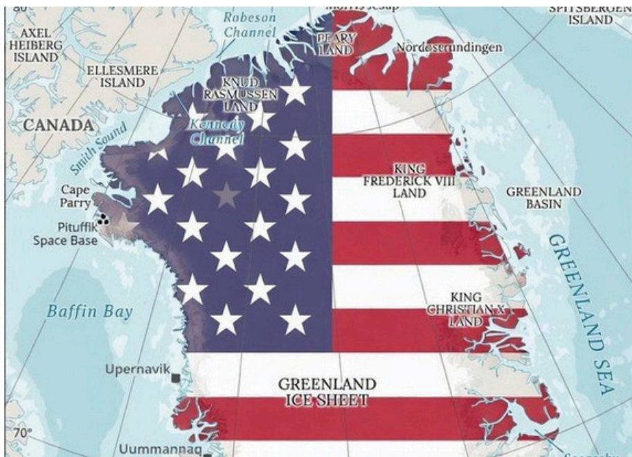
© Post on X by Katie Miller, the wife of President Trump's deputy chief of staff Stephen Miller