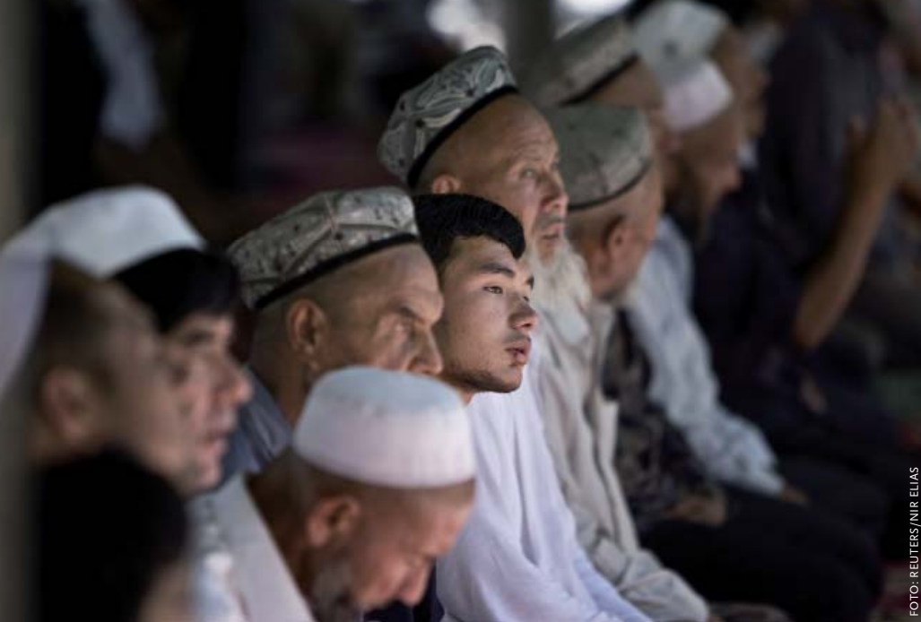
Het bezoek aan moskeeën, zoals hier in de Idhah-moskee in Kashgar, is aan strenge regels gebonden.