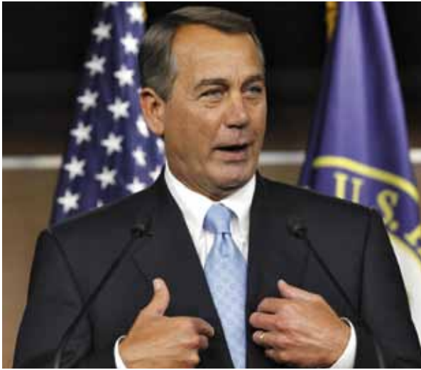
John Boehner voor de ontwikkeling van de tweemotorige JSF

Belangrijke maatregelen zijn onder meer de reducties in de sterkte van de landmacht en het korps mariniers met 47.000 militairen. De afgelopen jaren waren deze nog met 92.000 uitgebreid.