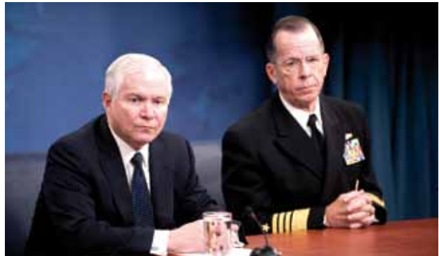
Minister van Defensie Gates en Admiraal Mike Mullen

en de C-17 transportvliegtuigen. Ook beëindigde hij de ontwikkeling van de CG(X) marinekruiser. Met de uitvoering van deze en andere programma's was een totaal bedrag van 330 miljard dollar gemoeid.