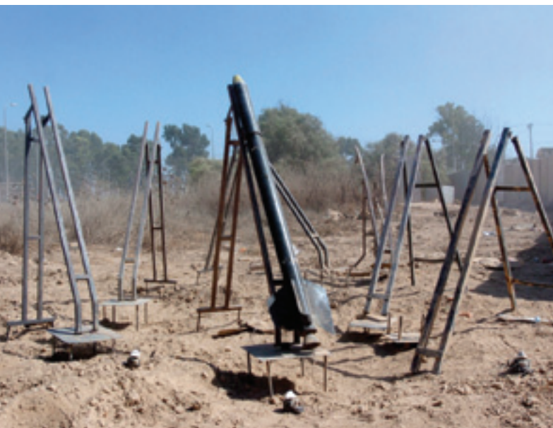
Acht Qassam lanceerinstallaties in Gaza.

Tot slot was er sprake van een asymmetrische strijd tussen Israël en Hezbollah, waarbij de asymmetrie in doeleinden belangrijker was dan die in middelen. De twee partijen hanteerden verschillende maatstaven voor een overwinning. Voor Israël was sprake van een zege indien Hezbollah totaal zou zijn geëlimineerd. Voor Hezbollah betekende een overwinning dat ze strijd zou kunnen blijven voeren. En dat was ook het geval.