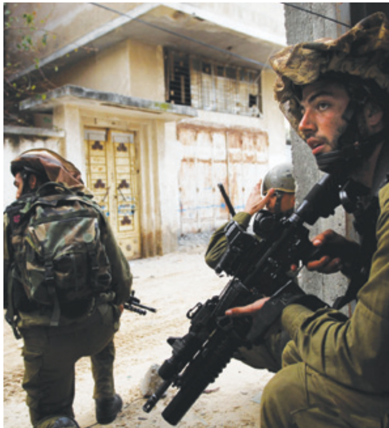
Grondtroepen in Gaza.

De raketten bereiken een snelheid van Mach 2,2 en het systeem is inzetbaar tegen kortafstand raketten en artilleriegranaten met een actieradius tot ongeveer 70 kilometer. Een van de belangrijke kenmerken van het systeem is dat het de baan van een gedetecteerde raket kan berekenen. Het onderneemt geen actie tegen raketten waarvan voorspeld wordt dat ze in onbevolkt gebied vallen. Deze worden om strategische en financiële redenen (40.000 dollar per afgevuurde raket) niet