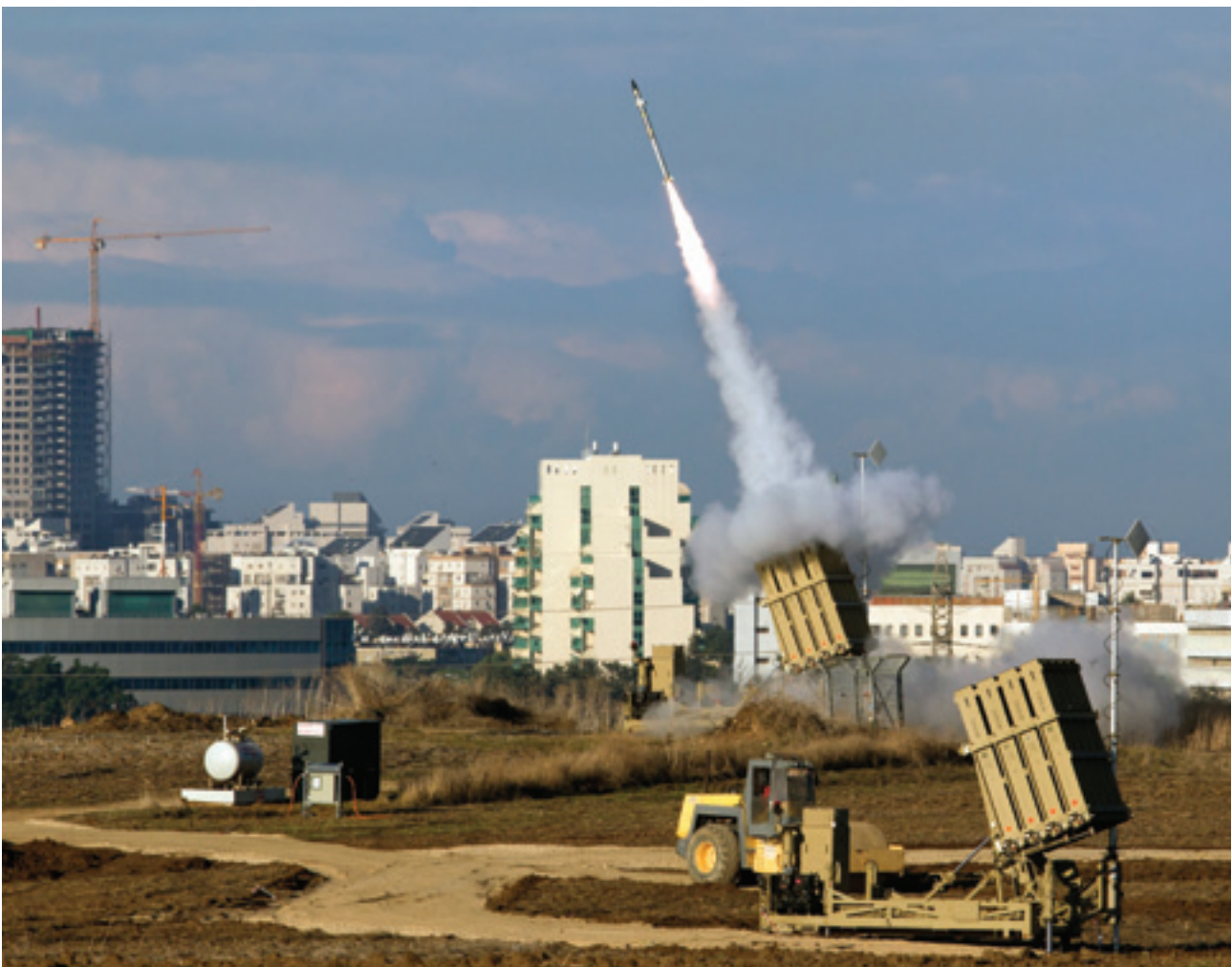
Een Iron Dome raket wordt afgevuurd in de omgeving van Tel Aviv.

Israël is in staat gebleken, zij het na harde en pijnlijke lessen, zijn formidabele krijgsmacht aan te passen aan nieuwe veiligheidsuitdagingen. Zonder diplomatie en staatsmanschap leveren die aanpassingen niet het gewenste resultaat op: een veilig Israël.